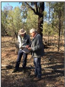
C Riley and C Plumridge examine Sorpresa